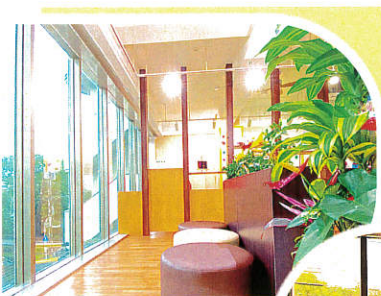
くつろぎ スペース